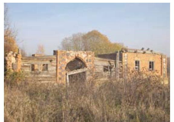
Iš mūrinio, tvirto tvarto telikę griuvėsiai, nors dar taip neseniai čia jis stūksojo keletą metų nešienautuose šabakštyuose.