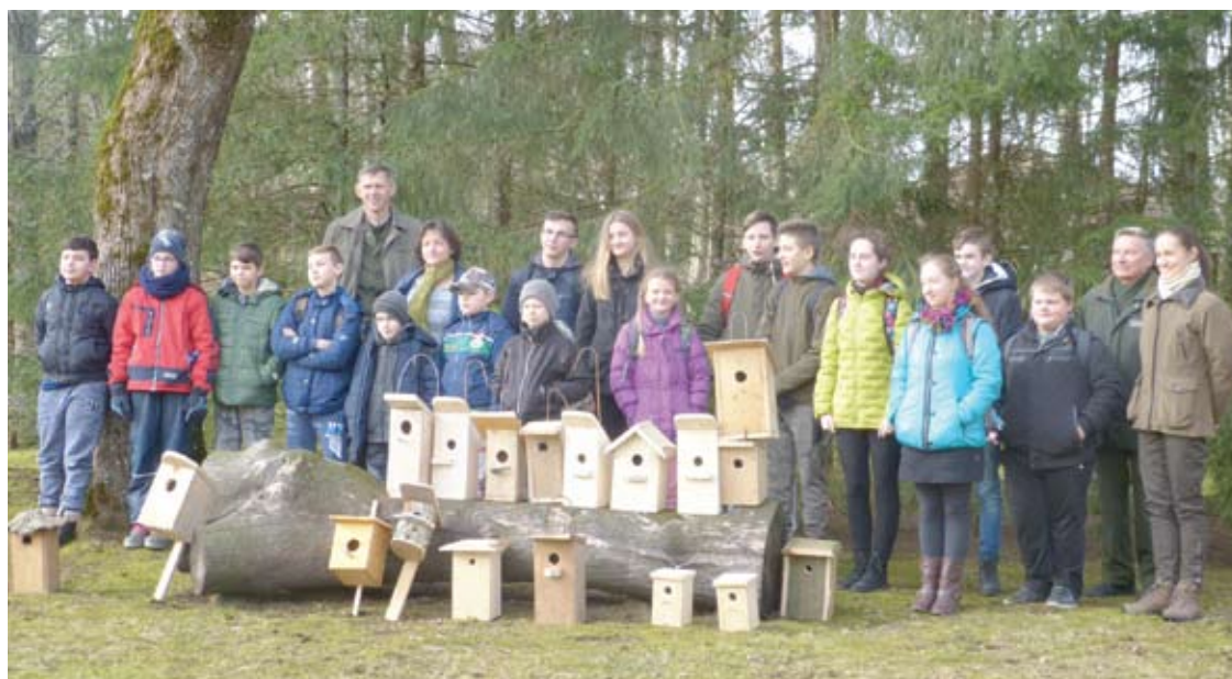
Viešintų pagrindinės mokyklos daugiafunkcio centro mokiniai - nuolatiniai Mikierių girininkijos svečiai.