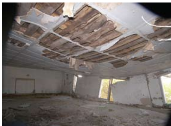
O čia vaikščioti jau pavojinga: viena dvarininko namo siena ir lubos bet kada gali nugriūti. Karo metais ji jau buvo sugriauta, o pokariu skubotai atstatyta.

Juozo Tumo-Vaižganto apysaka „Dėdės ir dėdienės“, kurios veiksmas plėtojamas baudžiavos laikais Savičiūnų dvare, kūrinys pervardintame į Saveikius, buvo išleista daugybę kartų tiek atskiromis knygomis, tiek ir kitų leidinių sudėtyje. (Nuotraukoje – 1978 metais „Šviesos“ leidyklos išleista apysaka iš serijos „Mokinio biblioteka“).