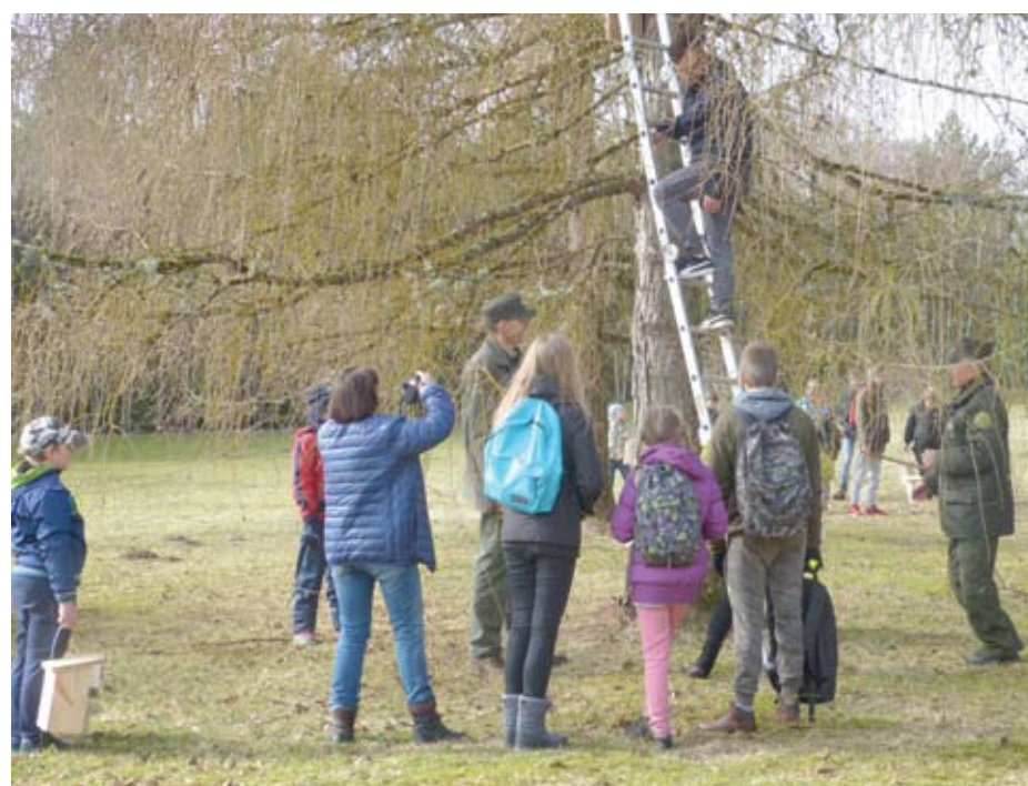
VIP-iniai sparnuočiai apsigyvens maumedyje įkurdintame inkile.