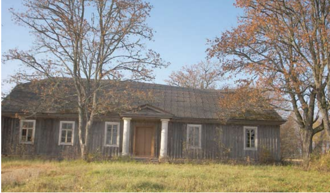
Baltų kolonų dabinamo buvusio dvarininko namo fasadinė pusė iš tolo dar atrodo lyg ir neblogai. Tačiau priėjus arčiau vaizdas sukrečia.

Savičiūnai, kaip kaimo vietovė, tikrai dar ilgai gyvuos. Tačiau koks išlikis ateities kartoms Savičiūnų kompleksinis kultūros paveldo objektas – labai abejotinas klausimas.